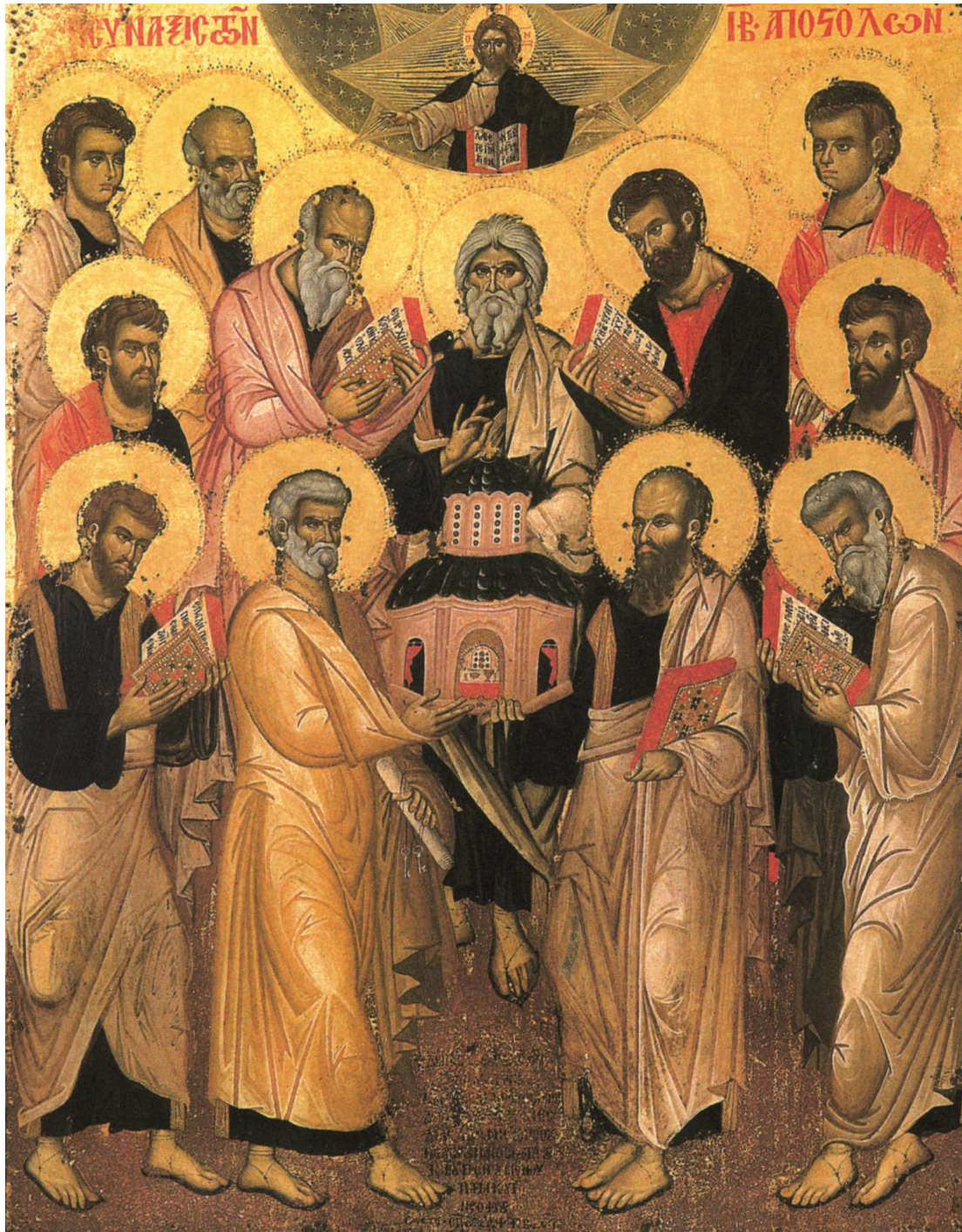
Icône byzantine « Les douze Apôtres »