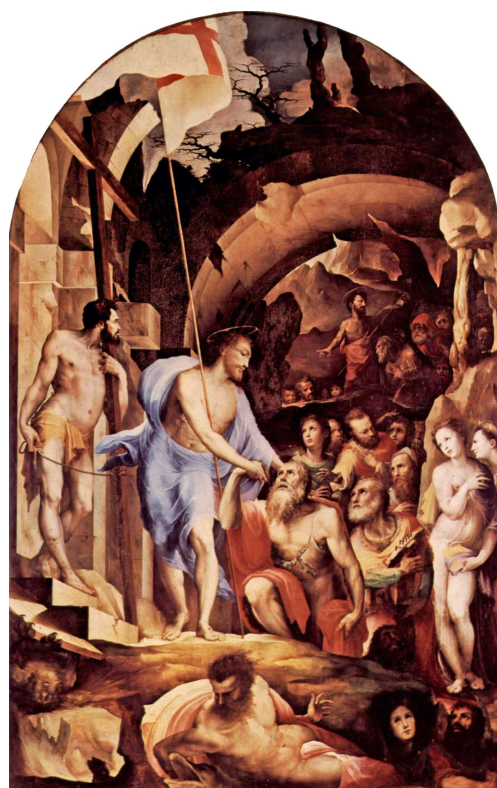
Domenico Beccafumi (v. 1485 – 1551)

Jusqu'au Christ, personne ne pouvait sortir du séjour des morts, le « rendez-vous de tout vivant » (Jb 30, 23). « Premier-né d'entre les morts » (Ap 1, 5), le Christ a ouvert les portes des enfers : c'est ce que représente l'épisode de la croix pascale, et c'est ainsi que les icônes représentent la résurrection, car c'est du fond de la mort que le Christ a fait jaillir la vie.