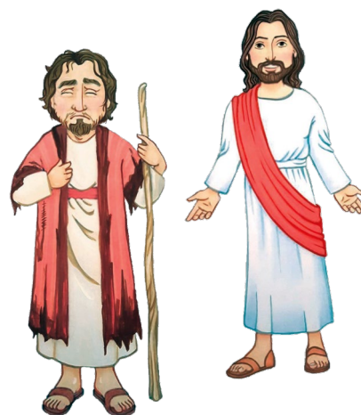
Jésus et l'homme aveugle