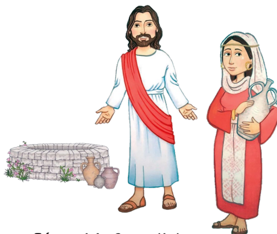
Jésus et la Samaritaine