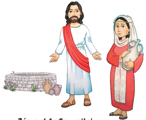
Jésus et la Samaritaine

Convertissez-vous et croyez à l'Évangile (Mc 1, 15)