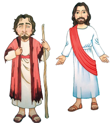
Jésus et l'homme aveugle

Que ma bouche soit marquée de la croix !