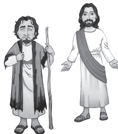
Jésus et l'homme aveugle