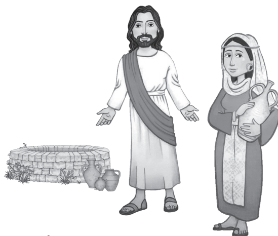
Jésus et la Samaritaine