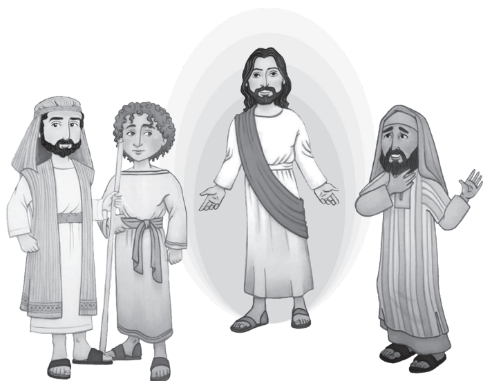
Jésus est transfiguré