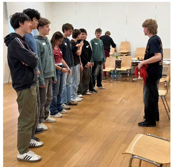
Vertrauensspiel: Schnur durch die Gruppe

Bei der Durchführung ging es lustig zu und her - vor allem, als die Jugendlichen auf einen Stuhl im Kreis stehen mussten, und dabei, ohne miteinander sprechen zu dürfen, sich nach dem Geburtsdatum aufstellen mussten. Am Ende haben leider nicht alle den richtigen Platz gefunden ;) Zwischen den Spielen gab es Theorieinputs zum Thema Nervosität und es wurde über die Rolle als Leitende/r diskutiert. Ein leckeres Znüni durfte natürlich auch nicht fehlen.