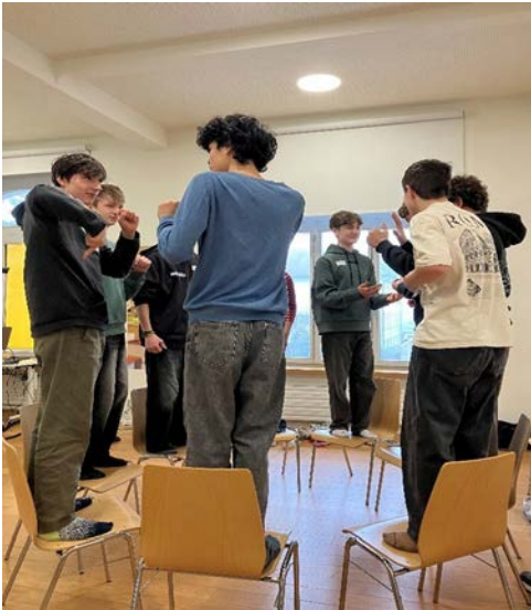
Vertrauensspiel: Geburtsdatum ordnen

Neun Jungs und ein Mädchen haben wir am Sonntag, 18. Januar im Péroles zu unserem Kurs für JungleiterInnen begrüßen dürfen.