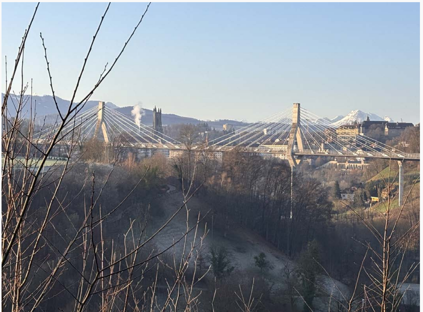
Poyabrücke by Manuela Huber