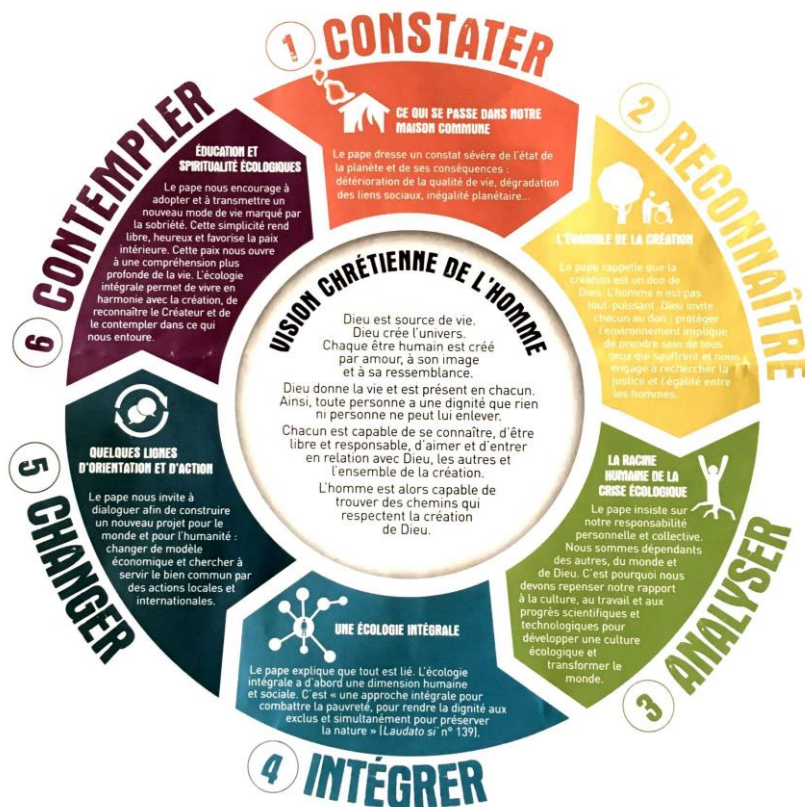
Figure 1

Les panneaux de l'exposition correspondent aux chapitres de l'encyclique :