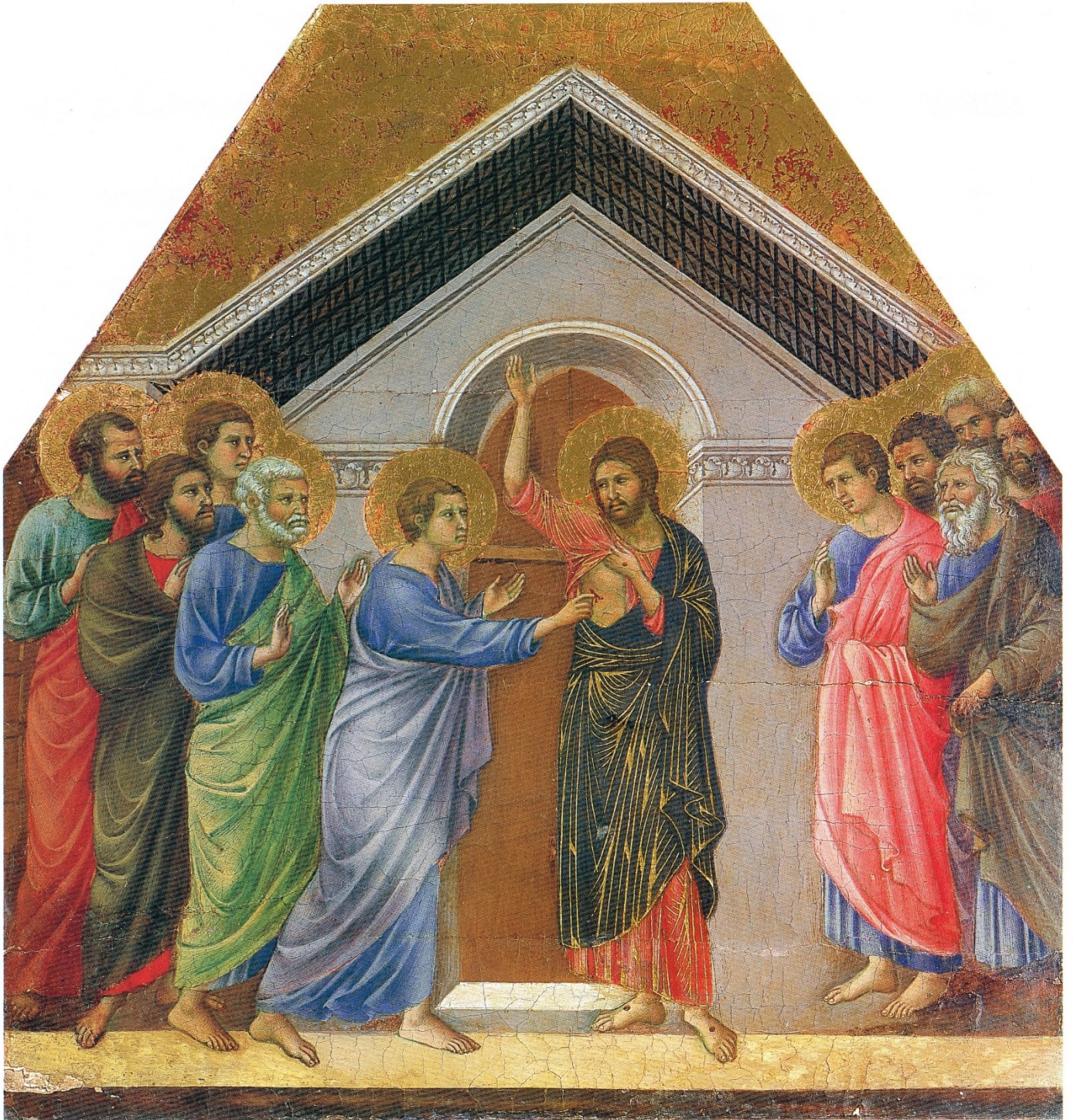
Duccio du Buoninsegna