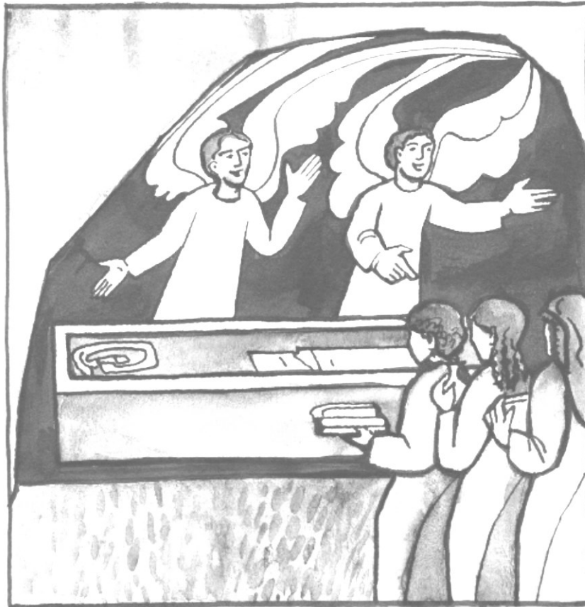
dessins Pascale Roze Huré

Le troisième jour après la mort de Jésus, le dimanche de Pâques, des femmes viennent au tombeau.