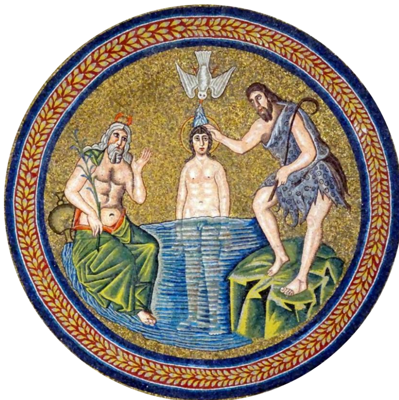
Mosaïque du baptistère des ariens de Ravenne (Italie)