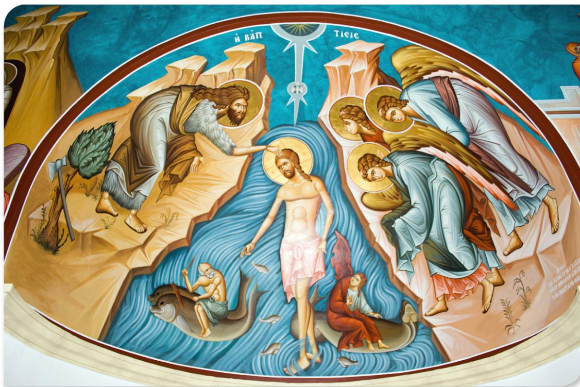
Fresque de l'église Saint-Jean-Baptiste sur le Jourdain (Jordanie)