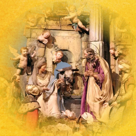
Crèche napolitaine (XVIII e siècle) de la basilique Notre-Dame à Fribourg. On doit à saint François d'Assise (1182-1226) la popularisation de la crèche de Noël.

(prière d'ouverture de la messe de la nuit de Noël)