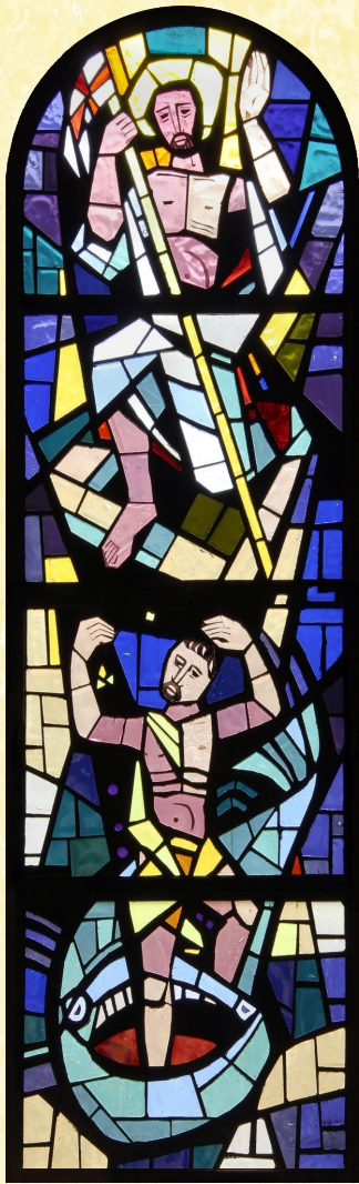
Les trois jours passés par Jonas dans le poisson (cf. Jon 2, 1) préfigurent la mort et la résurrection du Christ (vitrail de Yoki dans l'église de Broc).

Bénédition du feu lors de la vigile pascale