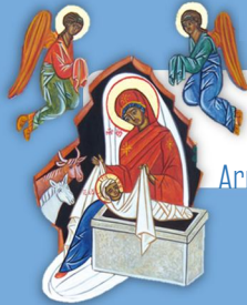
Armée céleste (nativité)

cf. Ep 1, 21 ; Col 1, 16 ; 1 Th 4, 16 ; etc.