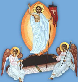
Annonce de la résurrection

cf. Ep 1, 21 ; Col 1, 16 ; 1 Th 4, 16 ; etc.