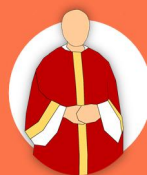
le presbytérat (les prêtres)