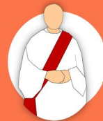
le diaconat (les diacres)

Lors de l'ordination, le candidat au diaconat reçoit le don de l'Esprit Saint pour la charge diaconale. Les deux éléments essentiels de l'ordination sont :