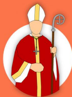
l'épiscopat (les évêques)

Le sacrement de l'ordre comporte trois degrés :