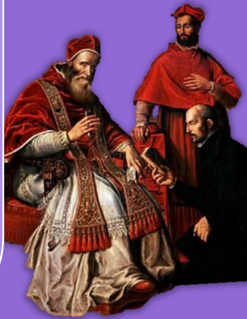
Ignace de Loyola et le pape Paul III

Gentilhomme au service du roi d'Espagne, Ignace de Loyola est blessé au siège de Pampe-lune en 1521. Durant sa conva-lescence, il fait une expérience mystique et entreprend de faire des études. C'est à Paris, en 1534, qu'Ignace et six compa-gnons décident de consacrer leur vie au Christ. Ils proposent leurs services au pape Paul III qui, en 1540, reconnaît ce nouvel ordre qui porte le nom de Compagnie de Jésus .