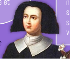
Anne de Xainctonge

Le récit de l'Annonciation, dans l'Évangile selon saint Luc (1, 26-38), introduit au mystère de l' Incarnation . Marie dit oui à l'annonce de l'ange Gabriel, et l'histoire entre Dieu et l'humanité prend un nouveau tournant. Jésus de Nazareth, pleinement homme et pleinement Dieu, vient assumer l'histoire humaine. Désormais tous les chemins humains sont aussi les chemins de Dieu. Pour saint Ignace, c'est dans l'épaisseur de nos vies humaines que Dieu se manifeste et vient offrir sa lumière.